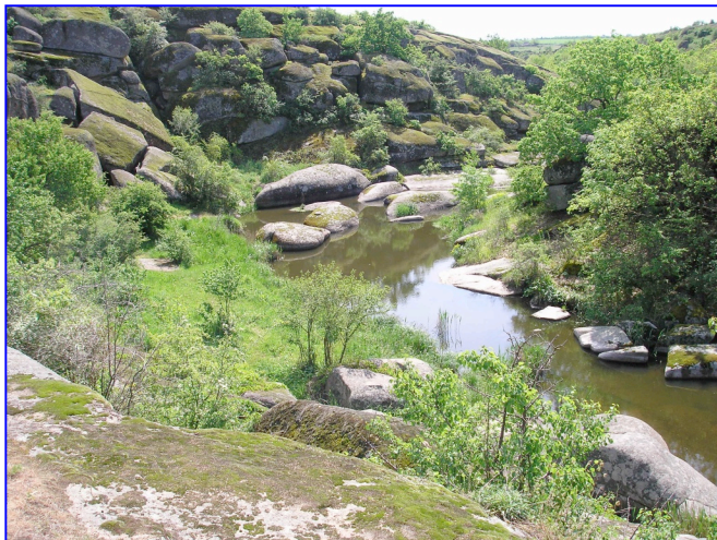
Козацькі пороги. Національний природний парк "Бузький Гард"

Хіоні І. О. Нові матеріали до історії бузького козацького війська / І. О. Хіоні // Український історичний журнал. - 1996. - № 11. - С. 123-127.