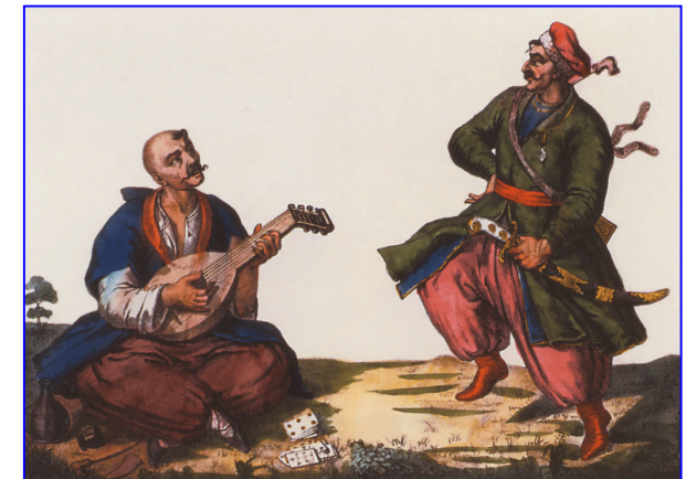
Запорозькі розваги. Гравюра Т. Калінського. 70-ті роки XVIII ст.

Яценко, С. Камінний літопис / С. Яценко // Радянське Прибужжя. - 1997. - 22 лист.